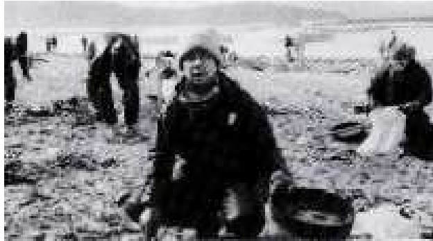
日本海重油回収ワーク